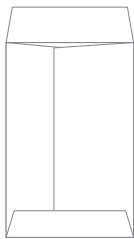
↑出来上がり 裏面図