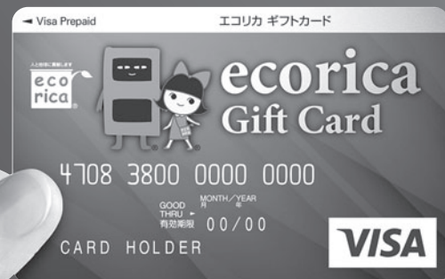
カードデザインは変更される場合があります。