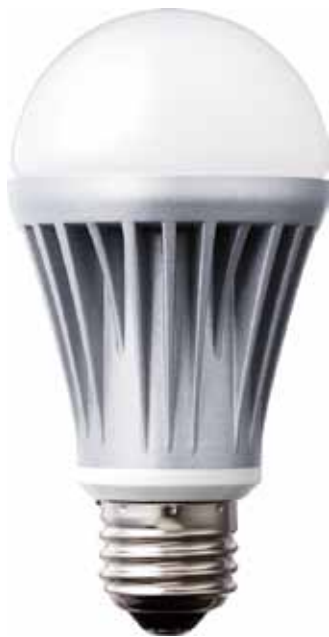
LDA11N-H-R1 (昼白色相当) エコマーク認定番号: 第13150001号

JISに基づく製品寿命4万時間の証明や、昼白色85lm/W、電球色70lm/Wの発光効率基準、平均演色評価数*1の適正基準など、エコマークによる厳しい検査や安全性の追求、厳格な品質基準をクリアした製品だけに対して付与されるエコマーク初の認定LED電球となります。