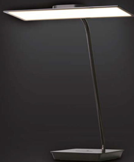
有機ELデスクライト 「ecorica OLED SKY」

さまざまな使用環境に調和するシンプルな本体デザインで、スライドタッチによる直感的な操作ができる7段階調光機能を搭載。使用シーンを問わず、誰にでも簡単にご使用いただけます。