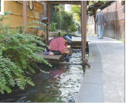
▲住民により大切に管理され活用されている「しがわこみち」