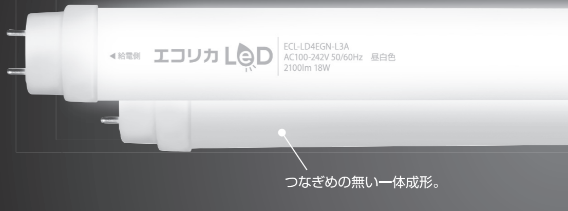
つなぎめの無い一体成形。