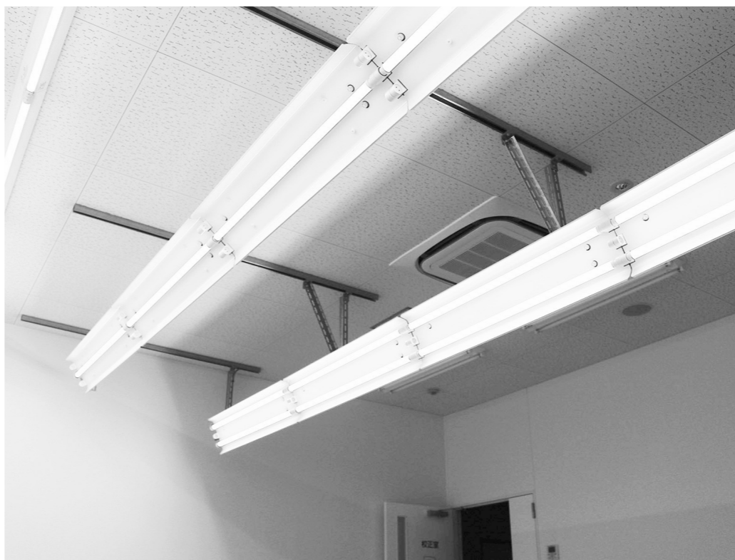
校正室に設置された演色AAA相当/Ra97を実現するエコリカLEDランプ

「色」を数値管理することは重要要素として捉えられている。このため、同社の校正室には、長年の現場